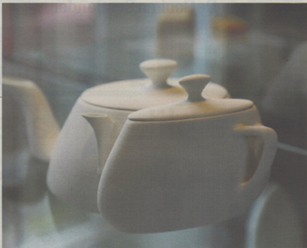
Werk van Louisa Zahareas.