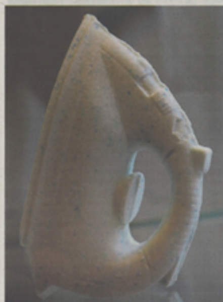
Werk van Fiona du Mesnil-dot.

nieuwe werkelijkheid, waarin de dingen zich in een andere vorm aandienen. Zo heeft een theepot op het scherm twee tuitjes en twee 'bulken', is een espressopotje een