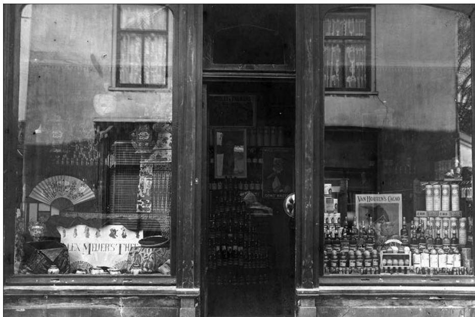
De etalage omstreeks 1915.

we rechtstreeks bij de importeur. Veelal “stomend”, wat zeggen wilde dat bij de bestelling de hele partij nog op zee, in de stoomboot zat.