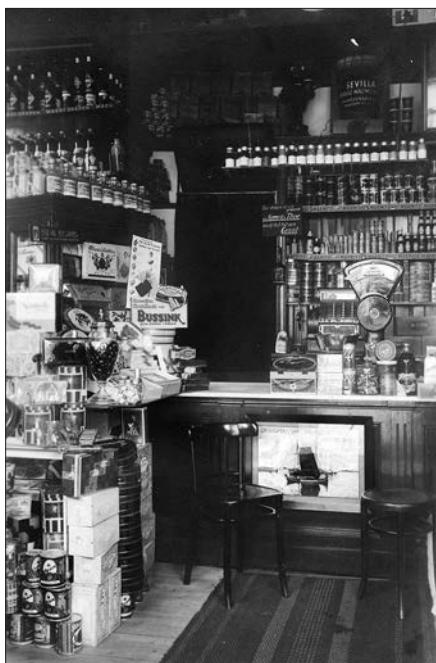
Het interieur van de winkel in 1927. Het kunstwerk tegen de toonbank is een reclamebord voor levertraan van 'Draisma-van-Valkenburg'.